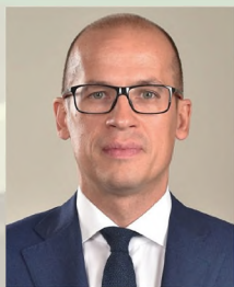
Глава Удмуртской Республики А.В. Бречалов