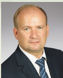
Председатель Сарапульской городской Думы С.Ю. Смоляков