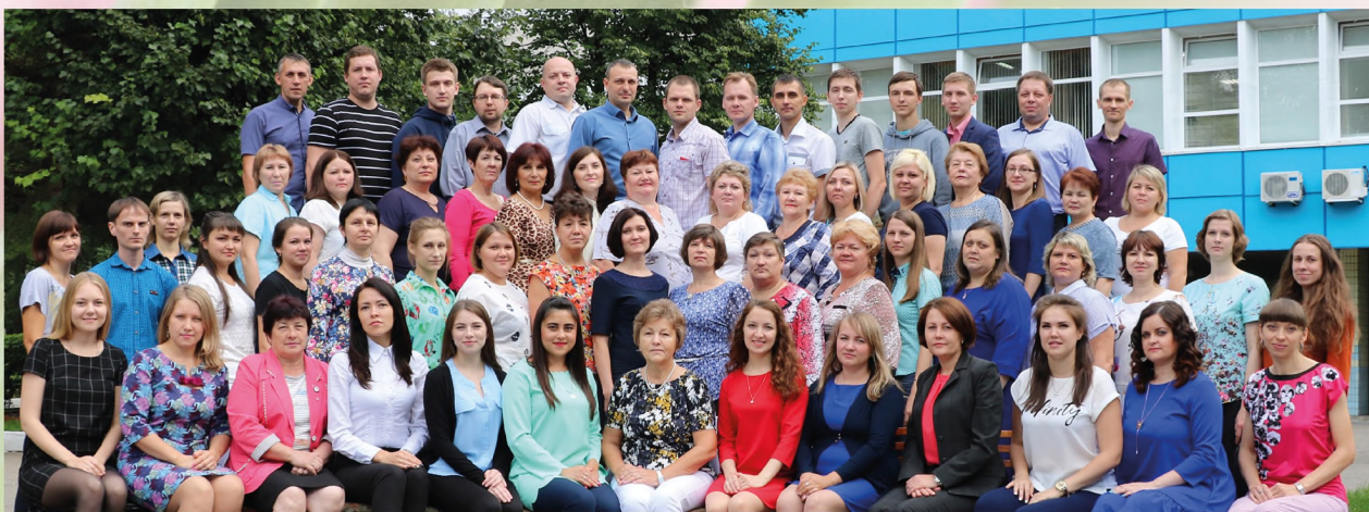
Коллектив отдела алюминиевых конденсаторов, 2017 год