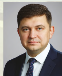
Глава города Сарапула В.М. Шестаков